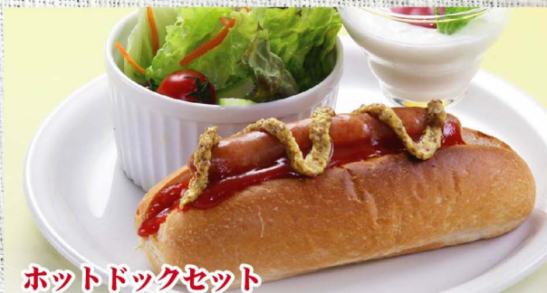
ホットドックセット

ご予約受付時間を AM 2:00迄とさせていただきます。 ご注文の際はご希望のメニュー・お届け時間ドリンクをお申し付けください。