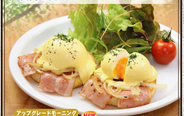
アップグレードモーニング New

アップグレードモーニングと致しまして特別価格にて、「エッグベネディクト」に変更できます。