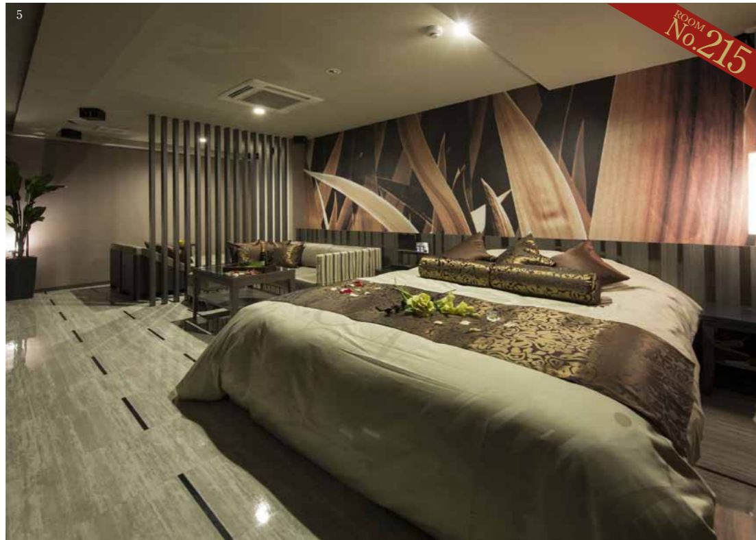
1.ワインカラーのインテリアが大人の雰囲気。ラグジュアリーな空間で大切な時間を過ごして 2.食事メニューやスイーツ、ドリンクも充実のラインナップ。宿泊すれば無料のモーニングも 3.高級ホテルでも使われているという肌触りの良いコマ糸のタオルなどアメニティも充実 4.館内の随所にグリーンをあしらひ、まるでリゾートを思わせる空間は心地よい雰囲気 5.広いベッドとマイクロバブルバスが贅沢なひとときを約束。迫力のシアタールームも人気