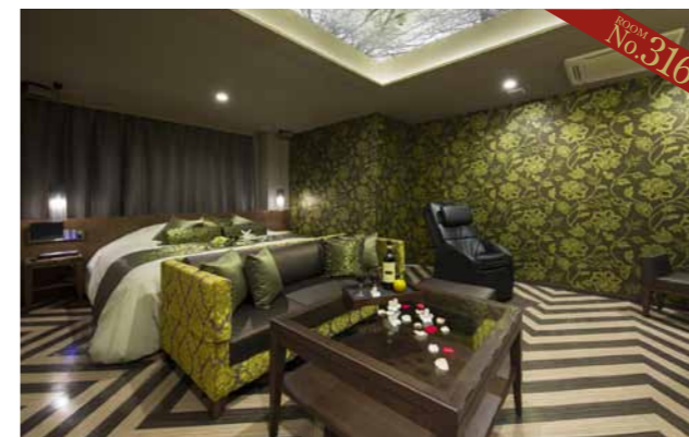
グリーンを基調にしたモダンな客室。マッサージチェア付なので、のんびり癒されたい

【休憩】2970円～8200円(6:00～24:00in 1.5h)、土・日曜、祝日、特別期間3270円～9020円(6:00～24:00in 1.5h) 【サービスタイム】4160円～9390円(6:00～10:00in 10h、10:00～18:00in 8h、18:00～24:00in 4h)、土・日曜、祝日、特別期間4580円～1万330円(6:00～10:00in 8h、10:00～18:00in 5h、18:00～24:00in 3h) 【宿泊】7010円～2万3530円(17:00～翌12:00、※21:00～翌6:00 ※チェックインから15時間滞在可能)、金曜7720円～2万5880円(17:00～翌12:00、23:00～翌15:00)、土曜、祝前日、特別期間8420円～2万8230円(17:00～翌11:00)、日曜7010円～2万3530円(17:00～翌12:00、※21:00～翌6:00 ※チェックインから15時間滞在可能)