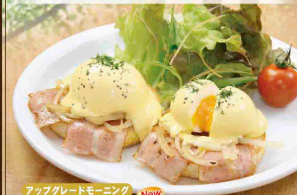
アップグレードモーニング New

アップグレードモーニングと致しまして特別価格にて、「エッグベネディクト」に変更できます。