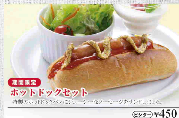
期間限定 ホットドッグセット